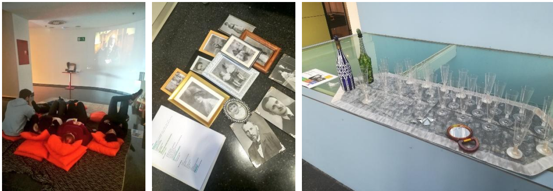
Fig. 2 Fotografies de l'experiència al voltant de Mirall Trencat a la Biblioteca Elisenda de Montcada i Reixac.