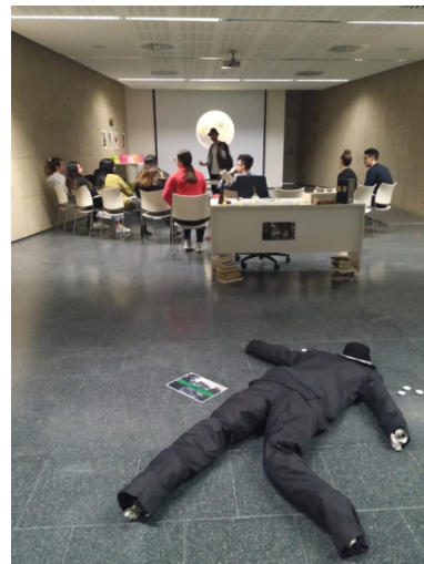
Fig.3 Fotografies de l'experiència Viure els clàssics, Luces de Bohemia a la Biblioteca del Sud de Sabadell.