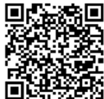
Mirall trencat 1925 ca. S. XX