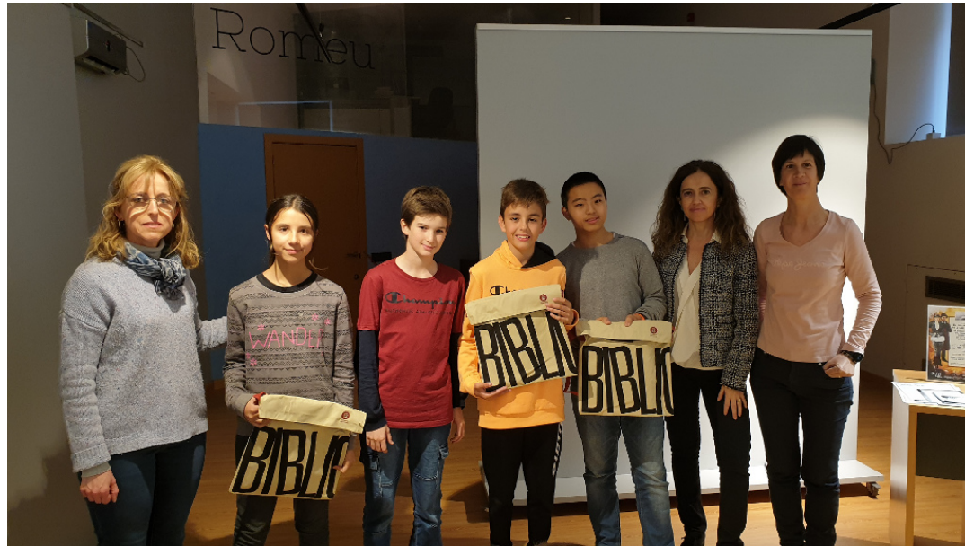
Lliurament de premis als guanyadors de la gimcana.