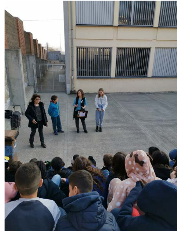
Roda de premsa i visita als Instituts en el marc del Programa Llegim +... amb els adolescents .