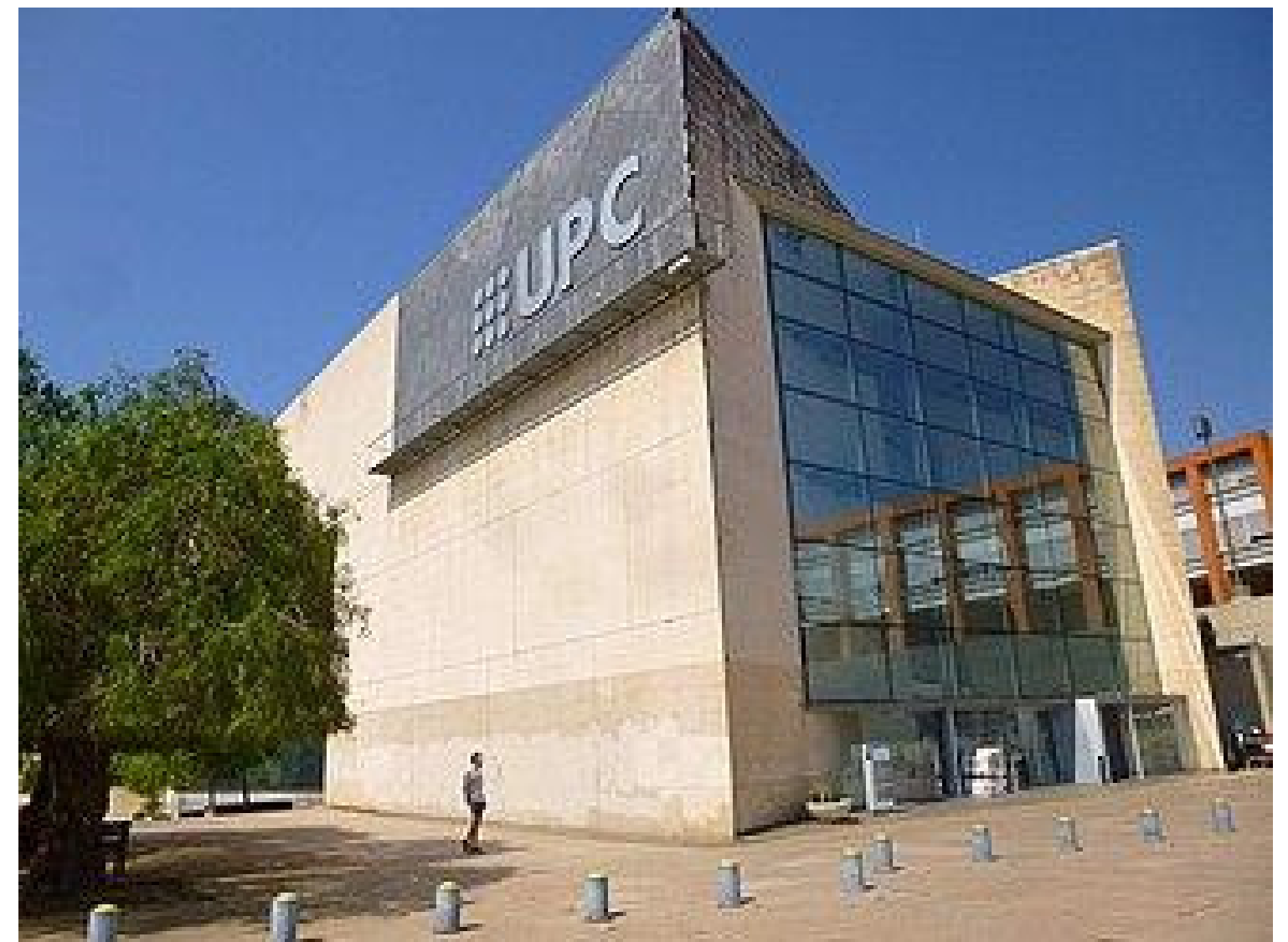
Biblioteca Rector Gabriel Ferraté (BRGF).

Universitat Politècnica de Catalunya · Barcelona Tech.