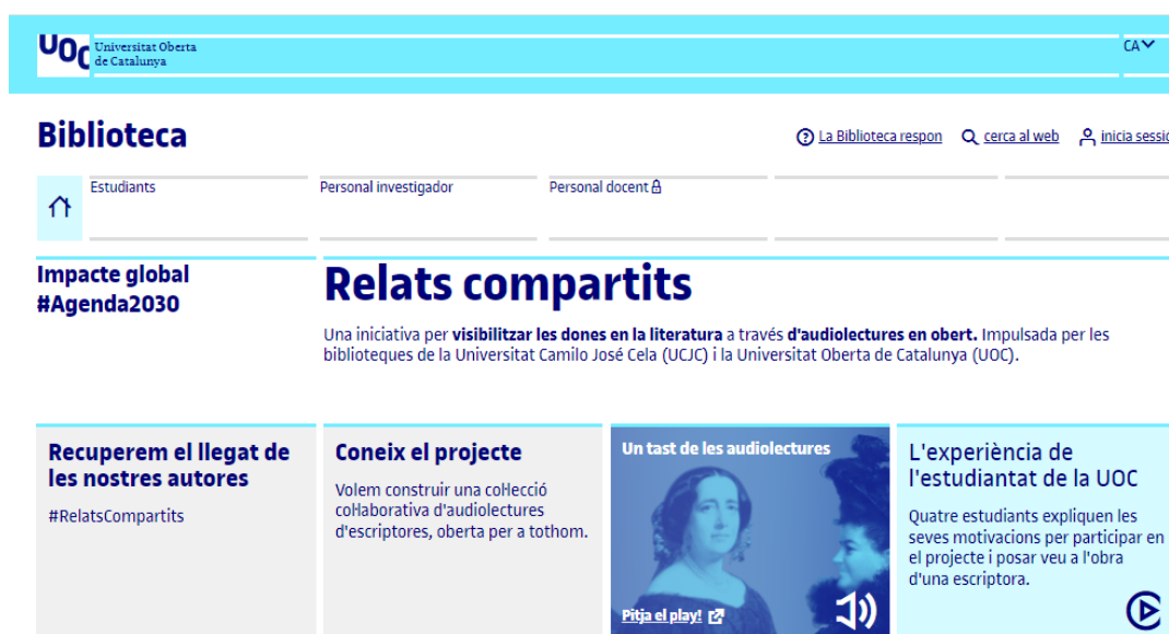
Figura 1. Pàgina web de Relats compartits

Amb l'objectiu de crear un canvi significatiu, Relats compartits es presenta també com una plataforma (Figura 1) que celebra i difon l'obra literària femenina, enriqueix el panorama cultural amb noves veus i perspectives, i té en compte també la diversitat d'accents, idiomes, etc.