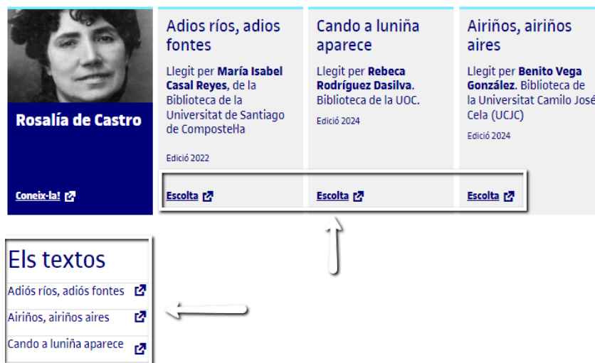
Figura 4. Exemple d'audiolectures i textos de l'escriptora Rosalía de Castro