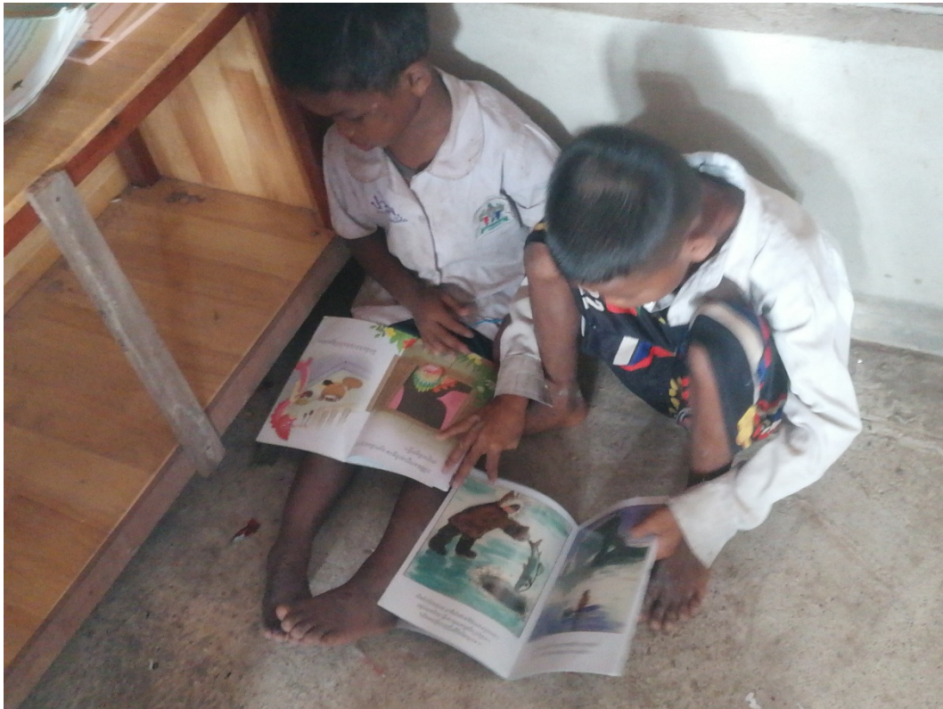
10. Infants amb contes bilingües anglès/khmer de la Biblioteca, Escola rural, província de Battambang.

El projecte de Foment de la lectura d'Orbrum treballa amb els objectius principals, que s'esmenten al Manifest de la Biblioteca Pública de la IFLA: 18