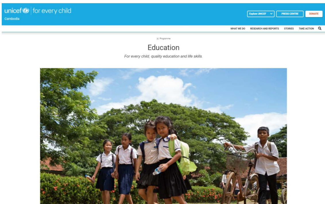
8. Unicef Cambodia, Education