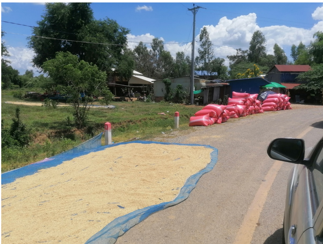
13. Assecant i preparant l'arròs per a la venda en sacs estandarditzats (2023).