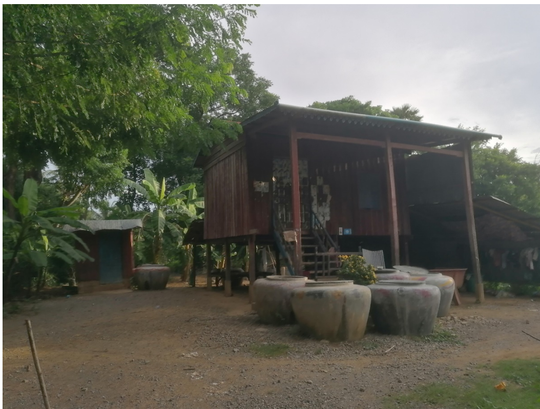
2. Casa en una zona rural (Província de Battambang 2023).

En aquest context, les grans zones rurals de Cambodja enfronten desafiaments específics pel que fa a l'accés a l'educació i els recursos de foment de la lectura. La manca d'infraestructures adequades, la distància a les escoles i la necessitat de suport a les tasques del camp poden dificultar l'assistència regular dels alumnes. A més, moltes escoles rurals tenen recursos limitats, amb escassetat de llibres, materials didàctics i mestres qualificats, fet que impacta negativament en la qualitat de l'educació que poden oferir.