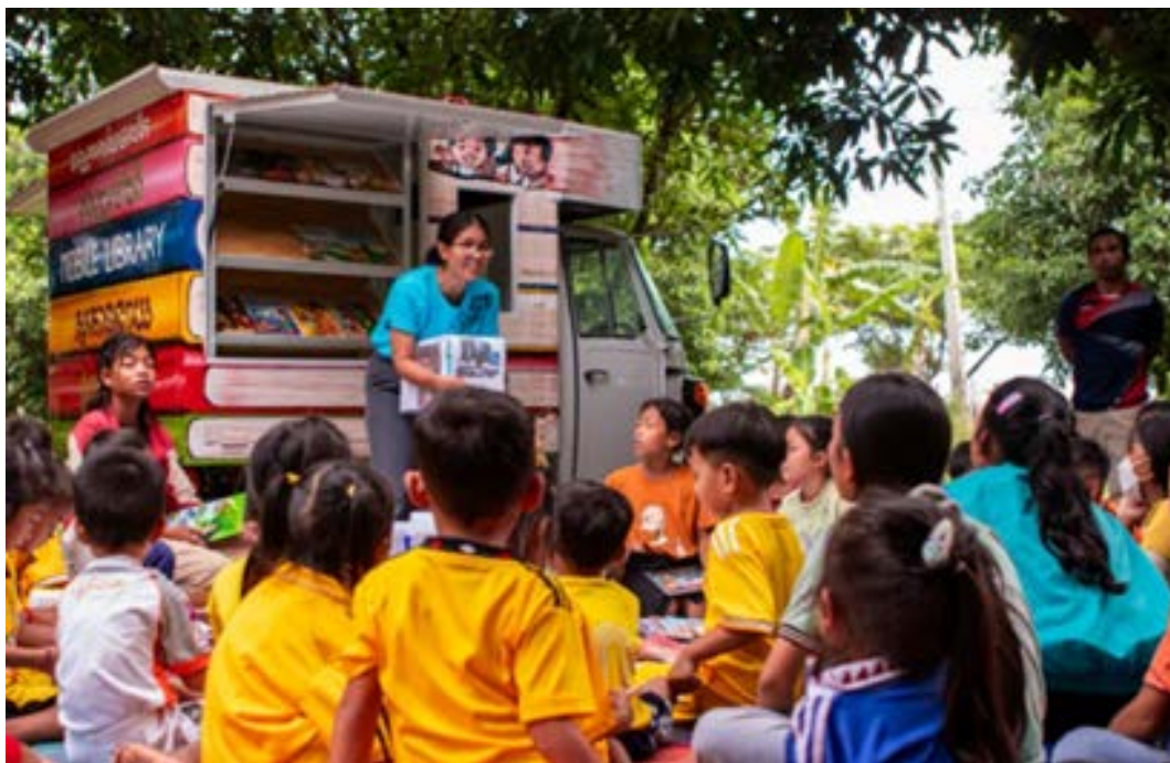
5. La biblioteca mòbil porta, art, llibres i alegria a les comunitats de Battambang

Altres organitzacions que han muntat biblioteques comunitàries i mòbils per arribar a comunitats amb accés limitat a recursos, i organitzen activitats per fomentar l'interès per la lectura. Un exemple molt dinàmic és el de Phare Ponleu Selpak, a Battambang. 9