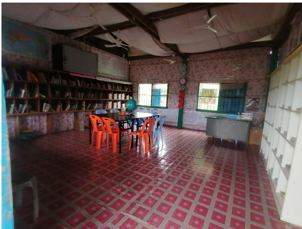
11. Biblioteca en una escola rural, província de Battambang.

adequats per a la lectura, amb mobiliari com prestatgeries i taules. S'ha adquirit una col·lecció diversa de llibres per a enriquir les biblioteques de les escoles que ja en tenen i per establir-ne de noves.