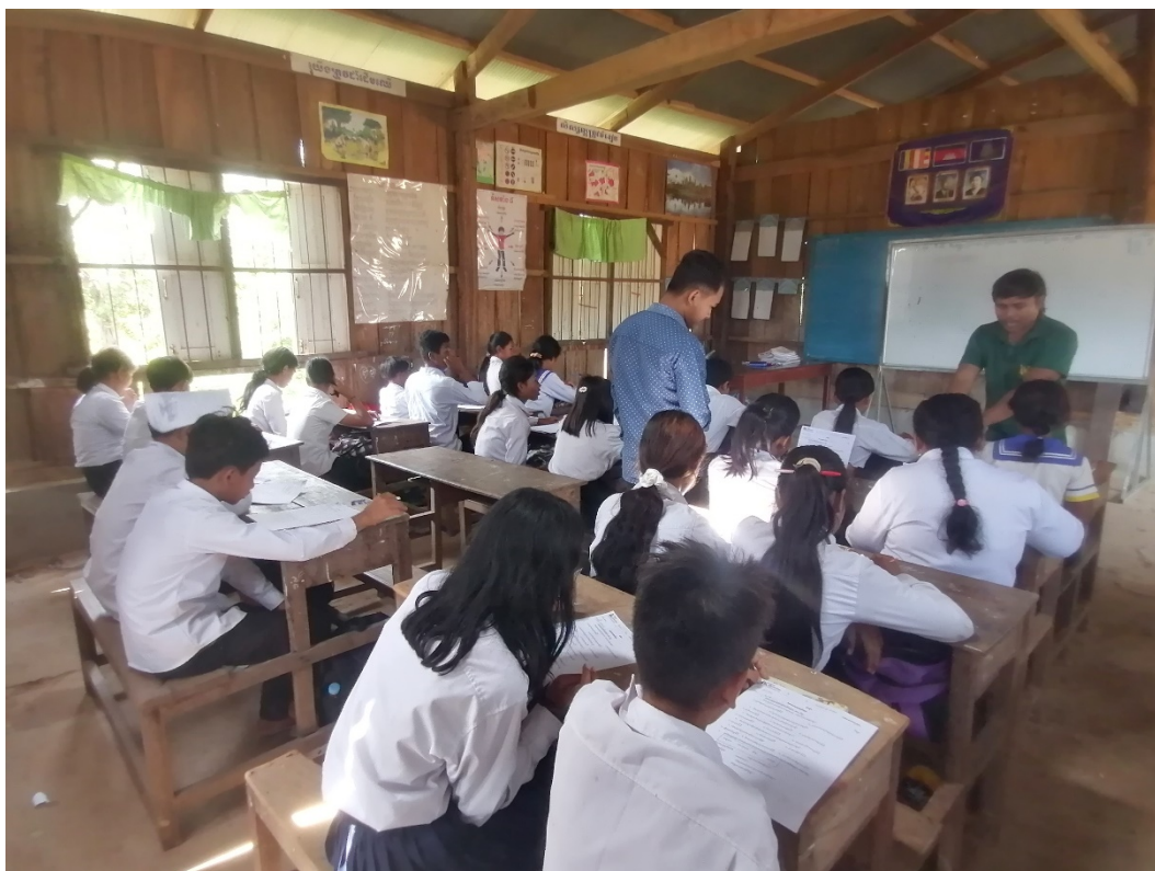
1. Aula en una escola rural. Província de Battambang (2023).

Es van construir i rehabilitar moltes escoles, i es va donar prioritat a la formació de mestres per assegurar una educació de qualitat, tot i que la manca de remuneració adequada afecta la seva motivació i, consegüentment, la qualitat de l'ensenyament. L'estabilitat política a partir del 2010 va impulsar un creixement econòmic que va permetre més inversions en infraestructures educatives. Amb tot, les desigualtats entre les zones urbanes i rurals continuen sent una barrera.