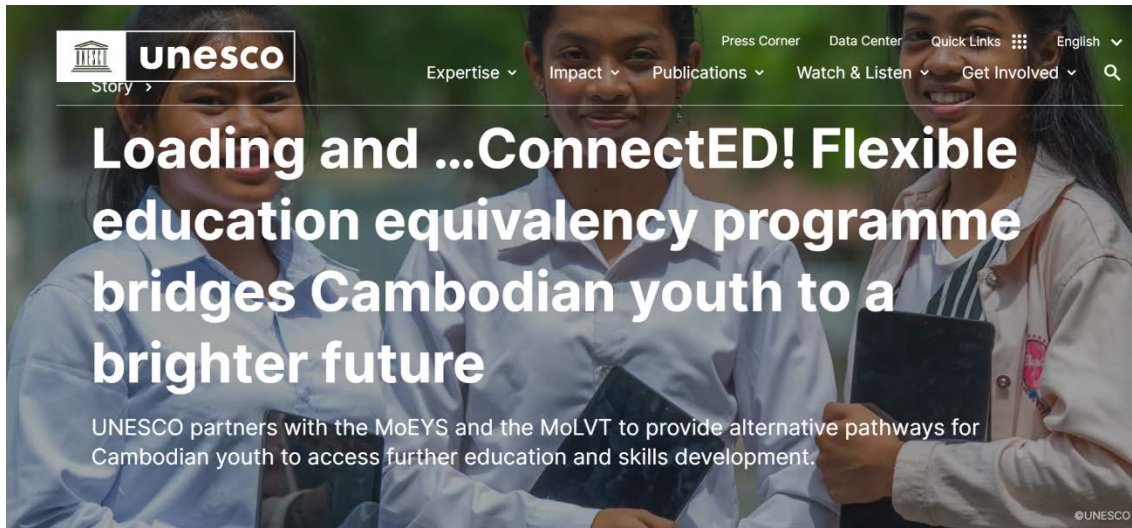
7. Unesco, Cambodja

El Suport d'organitzacions Internacionals com la UNESCO 11 i UNICEF 12 han proporcionat suport tècnic i financer per a programes de foment de la lectura. Inclouent la formació de mestres, la distribució de materials educatius i la implementació de programes d'alfabetització.