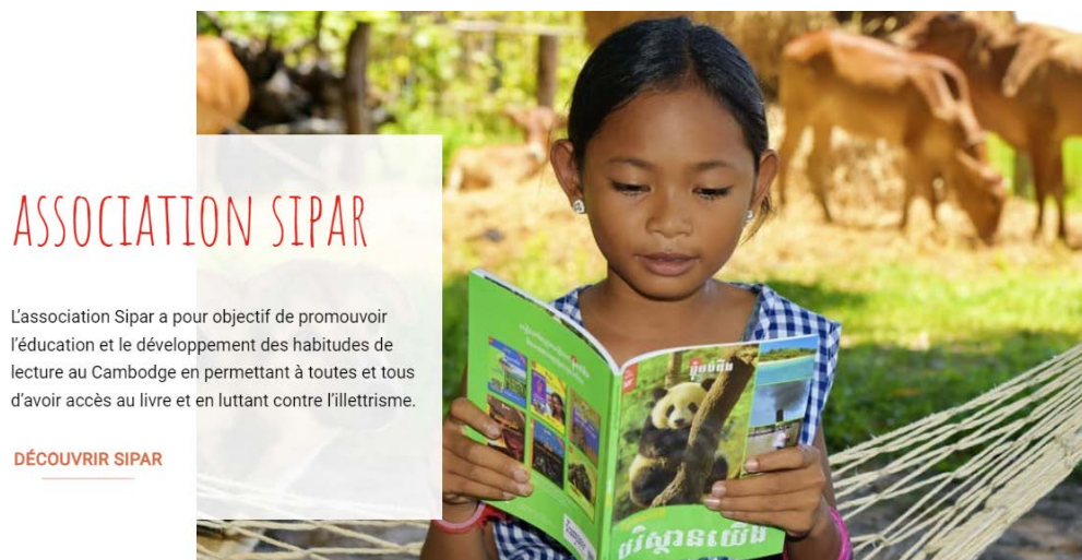
4. Objectiu de l'Associació Sipar

Sipar , 8 és una altra ONG activa a Cambodja que també se centra en el foment de la lectura. Ho fa a través de biblioteques mòbils, programes de lectura per a infants i la formació de personal educatiu. També han establert biblioteques comunitàries per facilitar l'accés a la lectura a zones rurals.