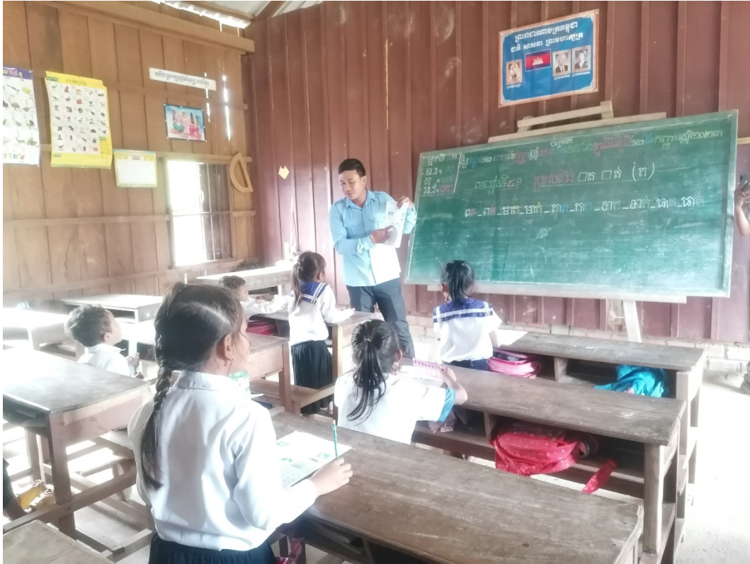
9. A classe en una escola rural, província de Battambang 2023.

Bàsicament construeixen i milloren infraestructures escolars per assegurar que les escoles siguin adequades i equipades per al seu propòsit educatiu. I donant suport als i a les mestres. 16