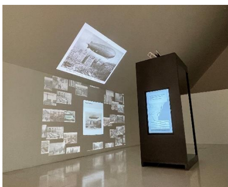
Fig.7 Postals de Barcelona 1888-1929