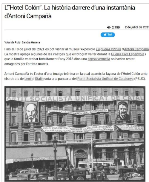
Fig.4 Blog "L'Hotel Colón. La història darrere d'una instantània d'Antoni Campañà"