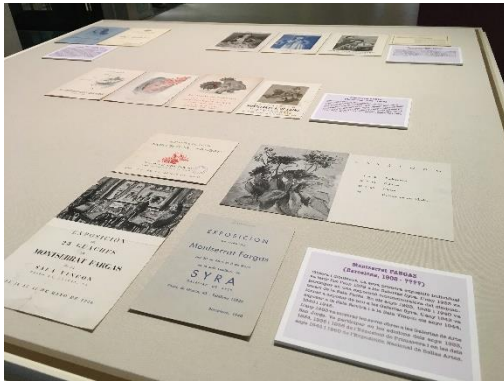
Fig.1 Exposició “L’empremta de les dones artistes a la Barcelona de postguerra”