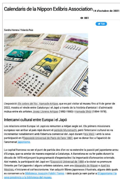
Fig.6 Blog “Calendaris de la Nippon Exlibris Association”