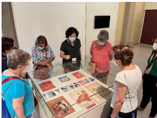
Fig.3 Visites Amics del MNAC