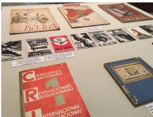
Fig.2 Exposició “Propaganda i Guerra Civil”