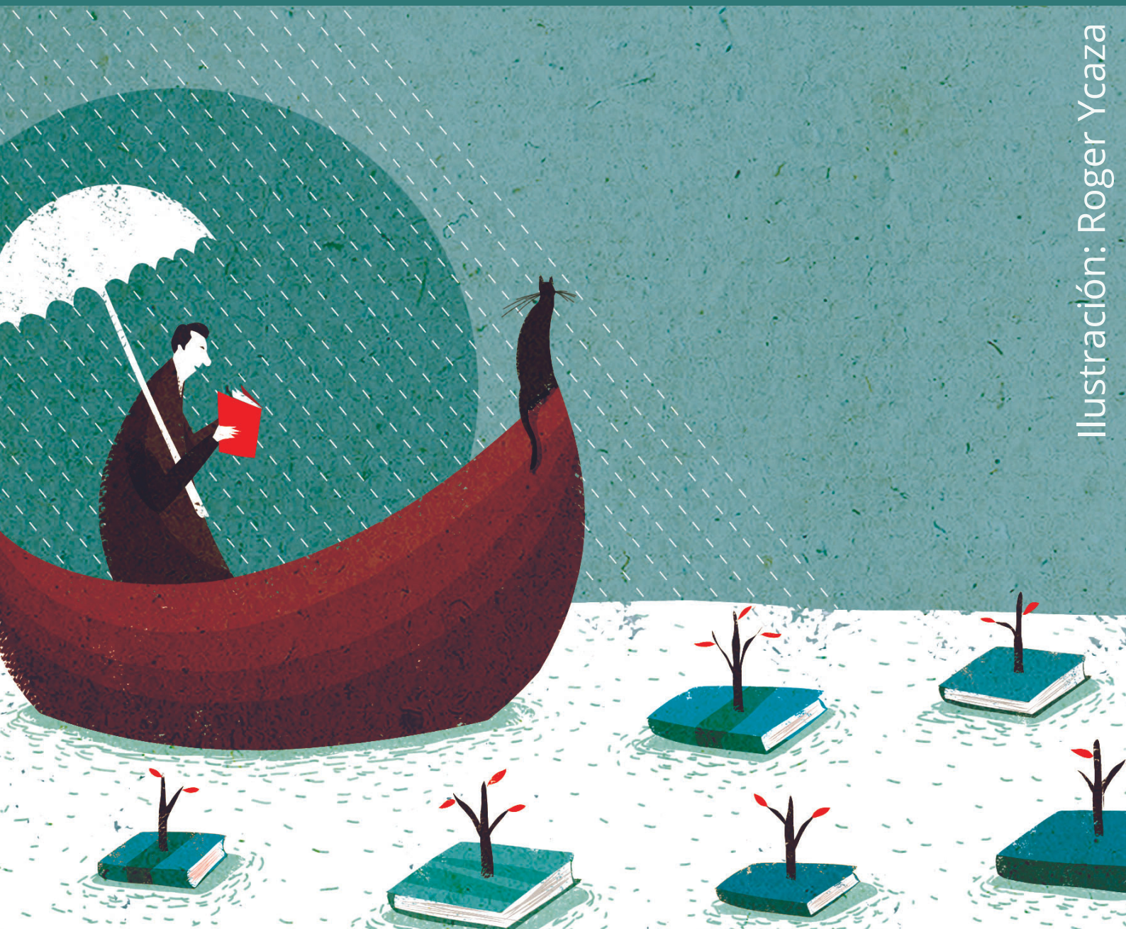
Ilustración: Roger Ycaza