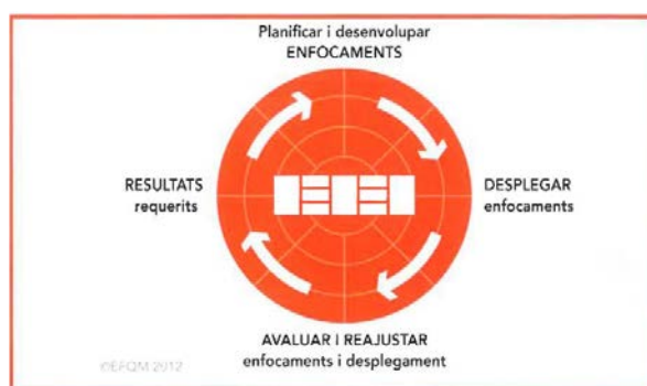
Esquema lògic REDAR del model EFQM

El Model EFQM ens aporta un marc que ens permet disposar d'una estructura bàsica per a un sistema de gestió que ens ajuda a donar una resposta adequada a les necessitats i expectatives dels nostres grups d'interès: