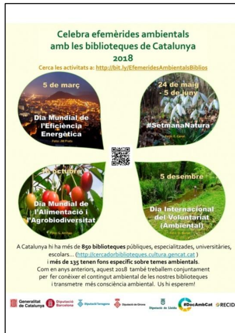
Figura 7. Cartell de les Efemèrides ambientals 2018

Les accions que es recullen en aquesta dates són divulgades en una mapa conjunt a GoogleMaps seguint unes senzilles instruccions que es troben a: http://bit.ly/EfemeridesAmbientalsBiblios