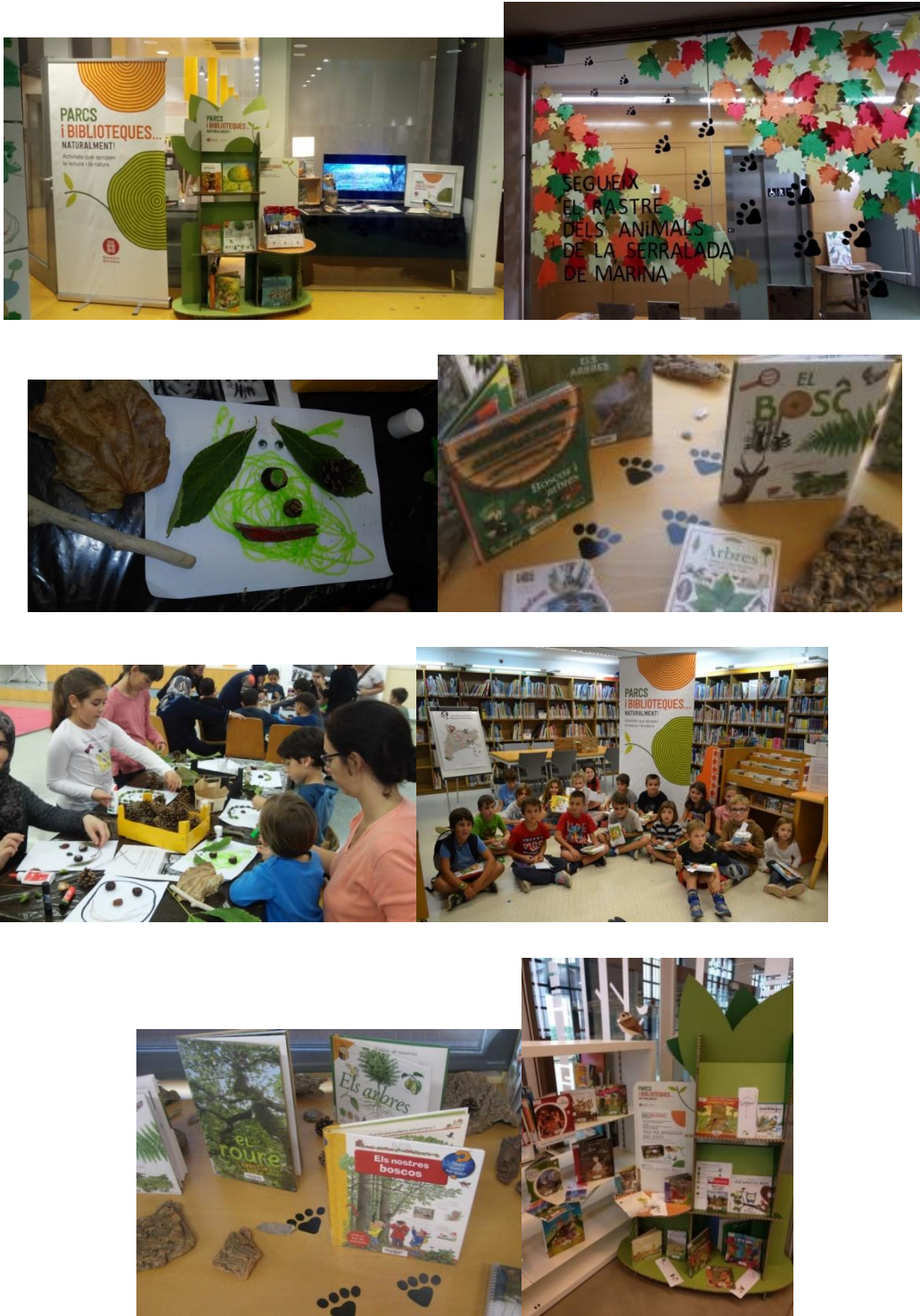
Figura 5. Diversos racons de “Parcs i biblioteques, naturalment!” i tallers realitzats en diferents biblioteques participants