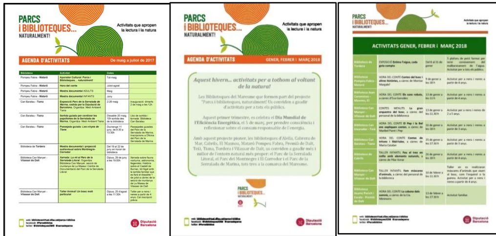
Figura 6. Mostra de pàgines de les agendes trimestrals