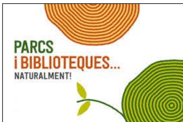
Figura 2. Imatge corporativa del projecte

Així mateix, els objectius genèrics del grup de treball són: