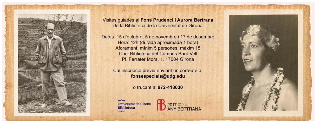
Targetó promocional de les visites al Fons Bertrana

Crèiem que el que podíem aportar és la nostra experiència pel que fa a l'ingrés, processament i difusió del Fons Bertrana al llarg de tots aquests anys. D'aquesta manera es varen programar unes visites al Fons amb l'objectiu de donar-lo a conèixer, sobretot entre la ciutadania, ja que havíem detectat que sovint en desconeixia l'existència. Aprofitant l'efemèride i les visites programades es van publicar els punts de llibre promocionals del fons, que inclouen l'ex-libris identificatiu, així com una cita literària del pare i una de la filla.