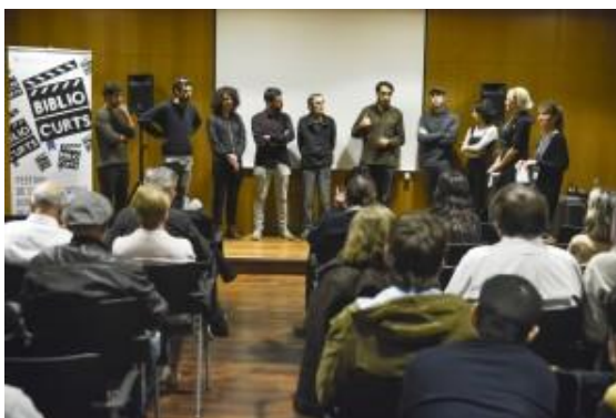
Foto 5. Imatge del col·loqui posterior a la projecció de la categoria Barcelona en Curt al Centre Cívic Vil·la Florida ( Bibliocurts 2016)

Què són les Q&A (questions&answers)? És la manera de fer referència en anglès a les “preguntes i respostes” que es fan al final d’una projecció quan aquesta compta amb la presència del director o d’algun altre membre de la producció. Aquesta pràctica de convidar els creadors a presentar la seva pel·lícula, rebre comentaris i contestar a les preguntes del públic és molt comuna als festivals i mostres de cinema i estableix un vincle entre l’espectador, l’obra i el públic. Ens atreviríem a dir que aquesta és una de les parts més gratificants d’un festival per a tots i cadascun del implicats. Durant les tres primeres edicions de Bibliocurts hem pogut organitzar gairebé diàriament aquests col·loquis amb la participació d’algun membre dels equips de producció, la majoria de les vegades, els directors i/o directores però també amb altres membres de l’equip com ara actrius i actors, productores i productors i/o guionistes i directores i directors de fotografia, entre altres. D’aquesta manera ells i elles han pogut compartir la seva visió i la seva experiència, explicar anècdotes i aclarir dubtes i rebre l’aplaudiment en persona.