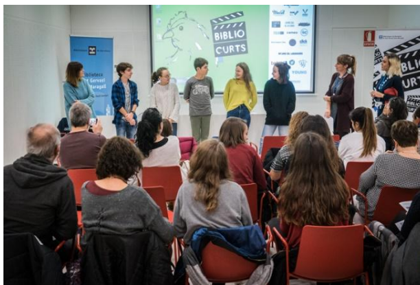
Foto 5. Imatge del col·loqui posterior a la projecció de la categoria Bibliocurts Jove amb la presència de molts dels joves directors i directores ( Bibliocurts 2017).

Des de l'edició de 2017 es va introduir a la programació del festival la secció Bibliocurts Jove la qual presenta i premia curtmetratges fets per nois i noies d'entre 14 i 18 anys. Amb l'experiència dels anys anteriors molt present, quan vam rebre bastants curts fets per creadors d'aquesta franja d'edat, i amb la intenció de donar-los visibilitat i una pantalla per exhibir les seves obres, vam introduir aquesta categoria que va tenir molt èxit en el seu primer any d'aplicació.