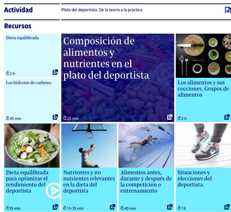
Imatge 2. Imatge d'un Niu (recull de recursos d'aprenentatge) dels estudis de Salut (FUOC, 2017)

Com es veu en la imatge, un Niu es presenta amb una estructura visual en forma de mosaic que permet a l'estudiant veure quina és l'activitat que ha de resoldre i quins són els recursos d'aprenentatge seleccionats per a resoldre-la. A més, cada recurs d'aprenentatge s'acompanya d'informació i orientacions que ajuden l'estudiant a planificar-se i organitzar-se.